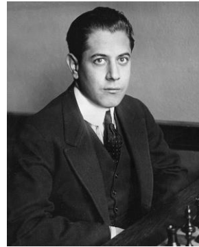
José Raúl Capablanca

Tenía un estilo tenaz, de gran lucha y constantemente puso a prueba a sus rivales en el tablero. Sostenía que el ajedrez debía jugarse con los principios posicionales, pero adaptado al estilo del rival de turno. Ha sido el campeón reinante por más años en la historia moderna