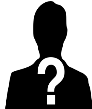
El Futuro ??????